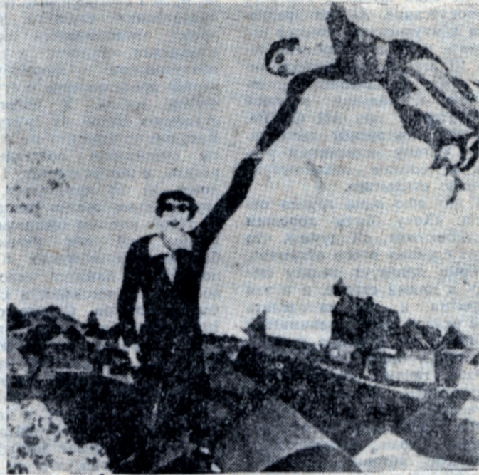
М. Шагал. «Прогулка». 1917. Ленинград, Государственный Русский музей.

Марк Шагал родился и вырос в еврейской семье. С детских лет знал он предания и легенды своего народа. Творческое формирование художника