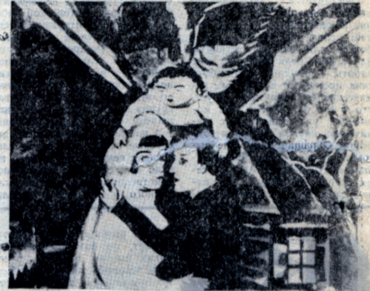
М. Шагал. «Свадьба». 1917. Москва, Государственная Третьяковская галерея.

Экспонируется более 100 картин и гравюр художника из музеев СССР и Франции.