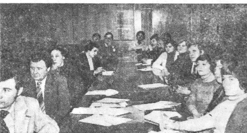
На совещании-семинаре сотрудников вузовских многотиражных газет.

Постановлением коллегии Министерства высшего и среднего специального образования СССР и Президиума ЦК профсоюза работников просвещения, высшей школы и научных учреждений лучшими среди четырехполосных газет были названы «Энергетик» Московского энергетического института, «Политехнические кадры» Челябинского политехнического института им. Ленинского комсомола и «Московский университет».