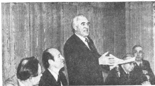
Перед участниками семинара выступает министр высшего и среднего специального образования СССР В. П. ЕЛЮТИН.

РЕКТОРАТ, ПАРТКОМ, КОМИТЕТ ВЛКСМ, МЕСТКОМ, ПРОФКОМ.