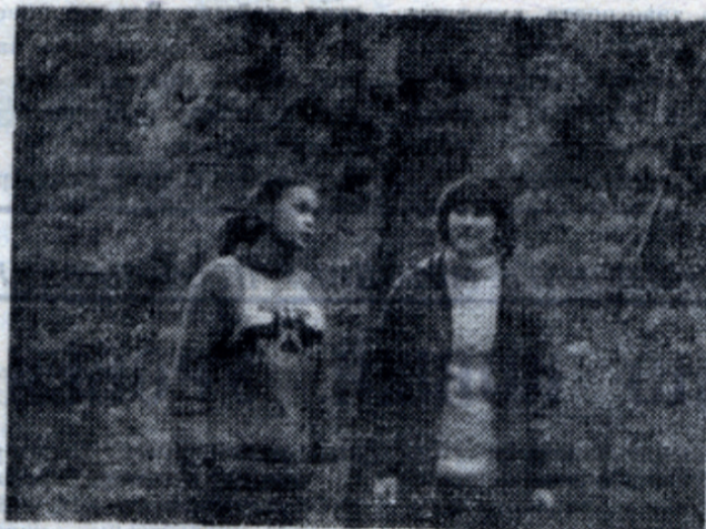
посвящения в студенты, который ежегодно организуют комитет ВЛКСМ и профком студентов МХТИ. На снимке: первокурсники ИХТ факультета в спортлагере в День посвящения в студенты.