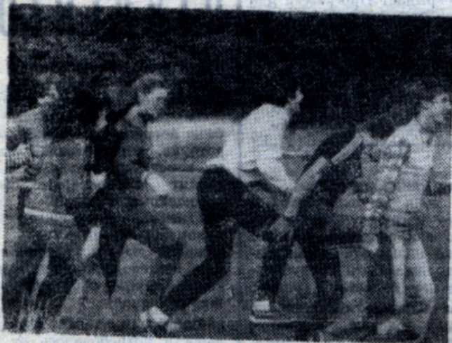
Традиционно интересно прошел на всех факультетах День посвящения в студенты, который ежегодно организуют комитет ВЛКСМ и профком студентов МХТИ. На снимке: посвящения в студенты.

Исключенный из профсоюза имеет право в двухмесячный срок подать жалобу в вышестоящие профсоюзные органы вплоть до ВЦСПС.