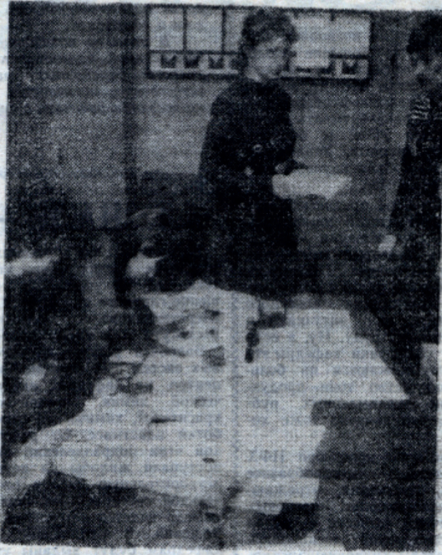
В институте проходит обмен профсоюзных документов. Организационно-массовая комиссия профкома студентов регулярно проводит учебу кадров по оформлению документов.

Что касается учебы организационно-массовой комиссии, то на ней хочется остановиться особо. Само название говорит за себя: «организацион-