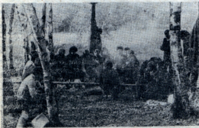
Такие дни остаются в памяти на всю жизнь как выражение славных студенческих лет. Посвящение в студенты.