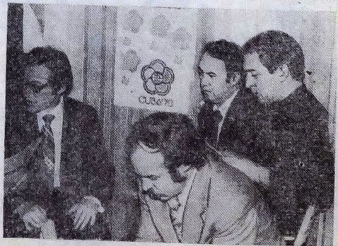
На одном из заседаний редколлегии. Вопрос серьезный. Надо подумать.

— Нет, такой проблемы у нас не было. Недостатка в материале мы не ощущали. У нас имелся «загон», т. е. статьи фундаментального характера, которые помещали в номера в случае надобности.