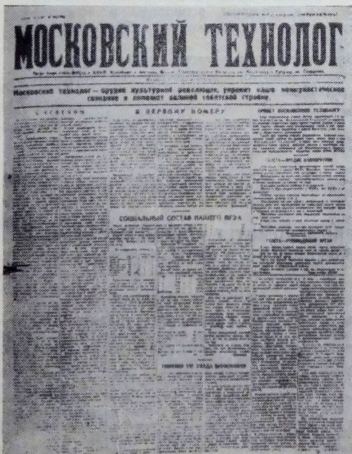
1-я страница первого номера «Московского технолога», вышедшего 15 февраля 1929 года.

Вечной тебе юности, дорогой «Менделеевец»! Больших успехов в реализации всех стоящих перед тобой задач!