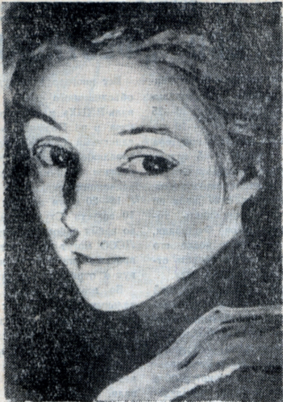
Девушка со свечой. Автопортрет 1911 г.

В галерее ИЦ с большим успехом прошла выставка, посвященная жизни и творчеству замечательного русского советского художника Зинаиды Евгеньевны Серебряковой. По просьбам читателей «Менделеевца» помещаем в газете статью о З. Серебряковой, написанную по материалам этой выставки.