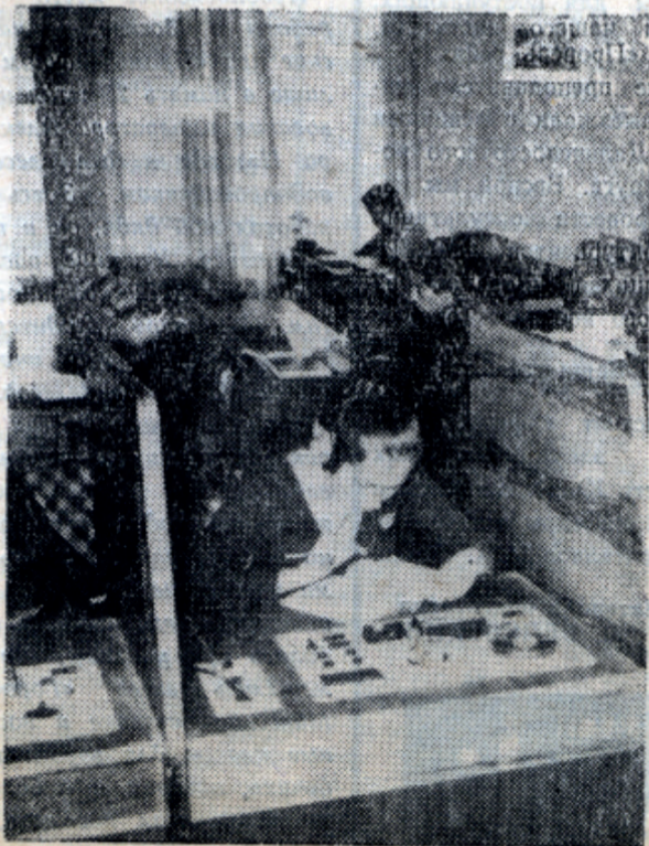
Лингафонные кабинеты ИЦ.