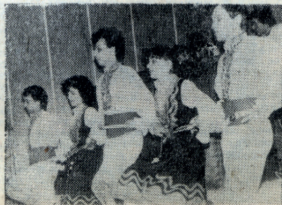
В интерклубе МХТИ им. Д. И. Менделеева