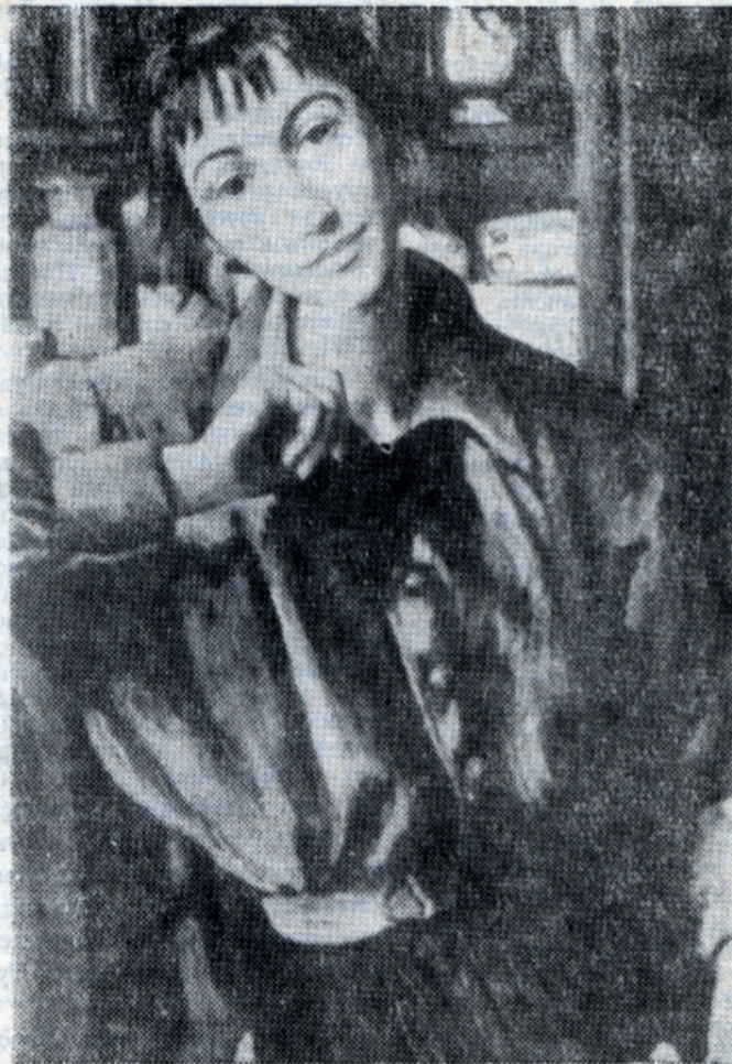
Автопортрет. 1923—1924 гг.

Во Франции Серебрякова создает ряд жанровых композиций («Торговка пирожками на Монмартре», «Парикмахер», «Читающий газету» и т. д.), возвращается к теме «Баня», и создает произведение, в котором варьирует решение 1913 года; дважды (в 1928 и 1932 годах) посещает Марокко, откуда привозит большое количество натуральных рисунков, регулярно пишет портреты (А. К. Бенуа, 1926; С. С. Прокофьева, 1926; К. А. Сомова, 1928 и т. д.); выполняет в частном доме около Брюсселя