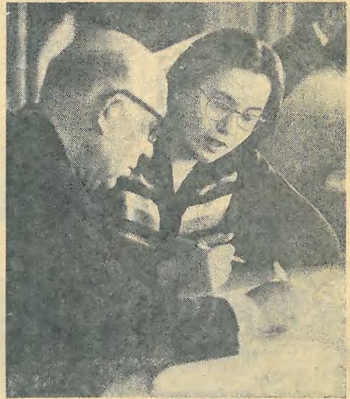
Идет экзамен по математике.