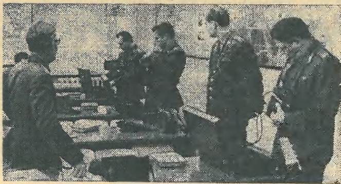
▲ Преподаватели кафедры готовят приборы к занятиям.