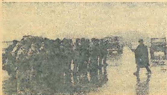
Взвод П-43 на учебных занятиях

Из листовки к пятилетию Красной Армии. 23 февраля 1923 года.