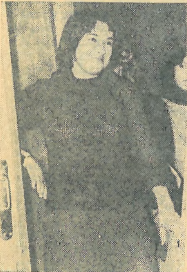
Не так уж и страшно.

Вот и закончилась зимняя сессия. Более трех недель отделяют нас от последних экзаменов. Уже подведены итоги, сдаю большинство задолженностей, а результаты будут в виде стипендии (или ее отсутствия) сказываться на жизни студентов в течение следующих шести месяцев. Уже лежат в учебной части сводки со средним и абсолютным баллами, процентом перевода и другими показателями. Но есть показатель, который не вошел