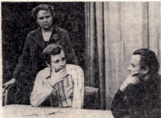
На снимках: сцены из спектаклей.