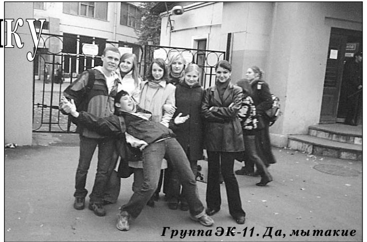
Группа ЭК-11. Да, мы такие