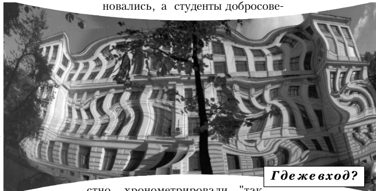
Где же вход?

Таким образом, два лектора соревновались, а студенты добросове-