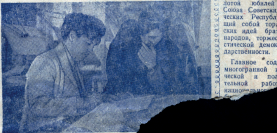
До экзаменов осталась неделя начертательной геометрии.