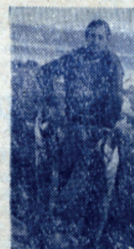
Хороша уха из такой рыбы да еще у водопада!

Вот уже много лет я и мои товарищи по работе проводим свои отпуска в походах. В этом году мы решили пройти по правому притоку Нижней Тунгуски—по реке Северной. Подготовка к походу началась, как обычно, задолго до отъезда. Разработка маршрута оказалась не простым делом—в городском клубе туристов о нем не имелось никаких сведений, а людей, которые побывали бы в тех краях, найти не удалось. Таким образом, нужно было полагаться только на карту.