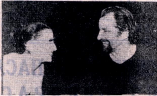
Майя Плисецкая и Морис Бежар после репетиции в «Театре де ля Монне».

Я прокатил более пятидесяти балетов по пятидесяти странам, а точнее — 90 по четырем континентам. Это моя работа. Я поступал как булочник, который должен выпекать каждое утро определенное число батончиков и булочек. Иногда я не могу уснуть, и все мои балеты превращаются в один у меня в голове. И чтобы стереть все это, я вынужден сле-