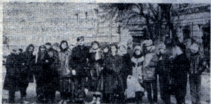
На одной из экскурсий по Миусской площади весной этого года.

Научно-методический Совет музея истории МХТИ.