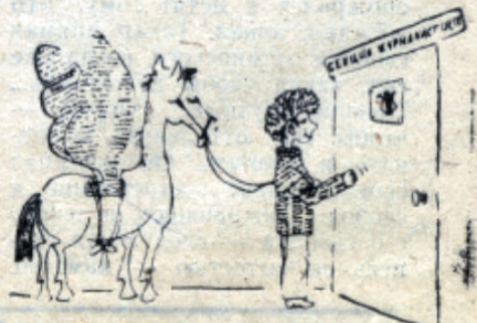
Рис. Н. ЖУРАВЛЕВОЙ.