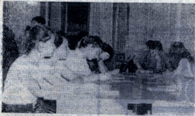
Оказывается, оформление документов — это очень непростое дело.

Подмосковья — 604 заявления, медалисты и приравненные к ним отличники техникумов и ПТУ — 301 заявление. 1048 человек имели право сдать два экзамена по эксперименту.