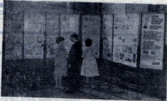
Сколько информации! Глаза разбегаются — какой факультет выбрать.

отв. секретарь приемной комиссии 1987 года.