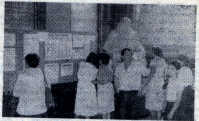
Уже висят списки счастливиц.

Вступительные экзамены проводились в два потока: с 11 по 21 июля. В результате экзаменов были зачислены 332 мужчины. Первый экзамен дал вузу 171 студента из числа медалистов и отличников, после двух экзаменов были зачислены 443 человека (по эксперименту). Проходной балл был единый по институту — 13, что говорит о сильном наборе студентов на первый курс. Будем надеяться, что они ос-