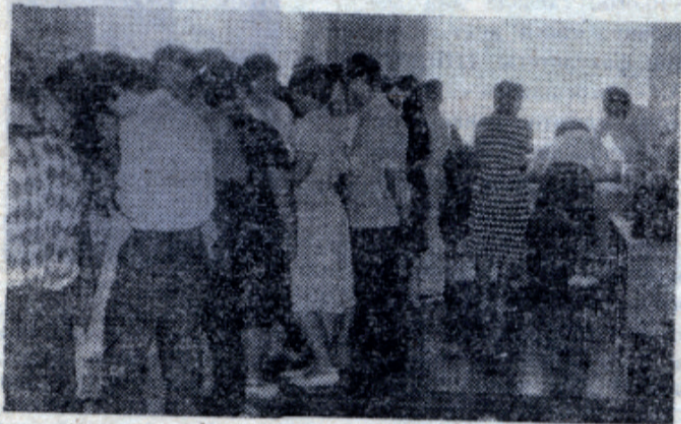
Очень много вопросов к членам приемной комиссии...

Всего в институт было подано 1890 заявлений, причем по факультетам эта картина выглядит следующим образом: КХТП — 157 заявлений на 60 мест; ИФХ — 249 на 125 мест; ИХТ — 284 на 120 мест; ТОФ — 287 на 130 мест; ХТП — 287 на 130 мест; ТНВ — 380 на 160 мест; ХТС — 246 на 120 мест. Абитуриенты-мужчины подали 555 заявлений; из Москвы и ближайшего