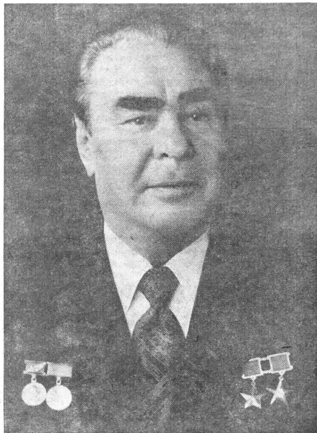
ЛЕОНИД ИЛЬИЧ БРЕЖНЕВ

19 декабря исполнилось семьдесят лет товарищу Леониду Ильичу Брежневу — верному сыну советского народа, выдающемуся деятелю Коммунистической партии, Советского государства и международного коммунистического движения, пламенному борцу за мир и социальный прогресс, последовательному марксисту-ленинцу.