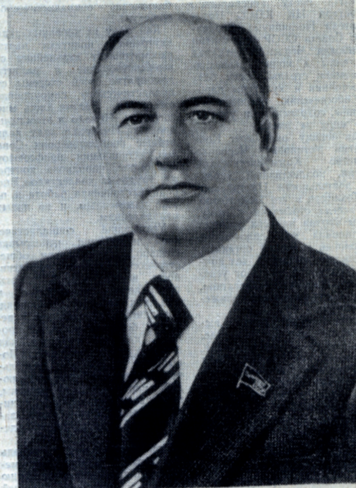
Генеральный секретарь ЦК КПСС Михаил Сергеевич ГОРБАЧЕВ

Тов. Горбачев М. С. заверил Центральный Комитет КПСС, что он приложит все силы, чтобы верно служить нашей партии, нашему народу, великому ленинскому делу, чтобы неуклонно осуществлялись программные установки КПСС, обеспечивалась преемственность в решении задач дальнейшего укрепления экономического и оборонного могущества СССР, повышения благосостояния со-