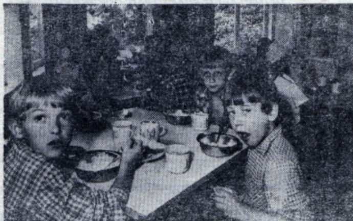
Быстро ложка дно нашла — каша вкусная была!

что он защищает спортивную честь пионерского лагеря и института.