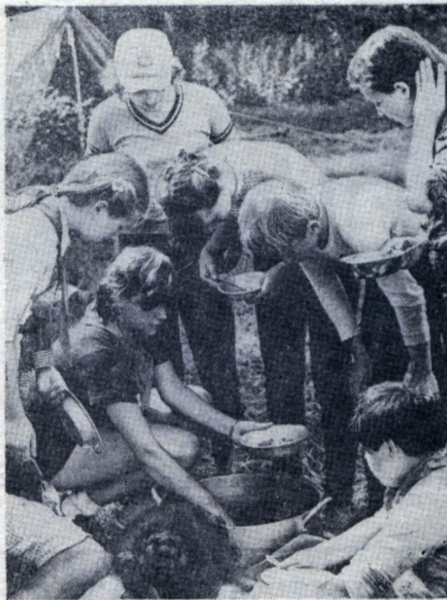
Пионерское наше походное лето для ребят золотая пора.

На наших глазах лагерь с каждым годом преображался. Сначала появились две беседки по дороге на футбольное поле, сейчас к ним пристроили зеленый театр. Организованы различные кружки, а в наше время развлечений было маловато. Но мы не скучали. Всегда находились какие-то интересные дела, начинателями которых были любимые вожатые. И я сейчас вспоминаю одного из них: это был самый любимый нами старший вожа-