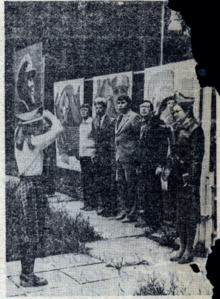
В 30-й раз взвигается вверх флаг, знаменуя открытие лагеря.