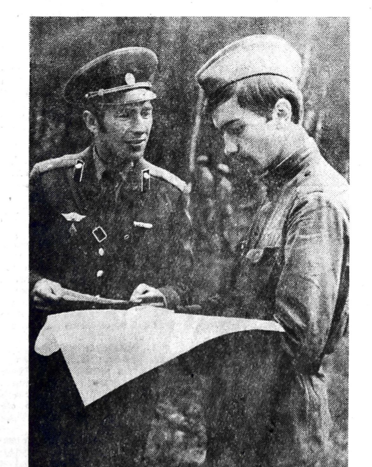
Преподаватели щедро делятся с нами знаниями и опытом