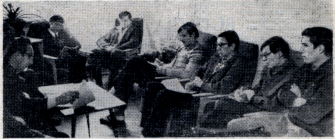
Плодотворно работали все секции. На снимке: занятия членов спортклуба.

Другая важнейшая задача — ликвидация разрыва между созданным у нас научным заданием и его промышленной реализацией. Многие научные достижения еще слабо используются на практике. Для внедрения науки в производство нужно прежде всего усилить среднее звено, то есть вузы. Это в полной мере относится и к МХТИ. У нас намечен ряд мер, в частности, усиление роли такого предмета, как экономика химической промышленности, превращение ее в одну из основных дисциплин. Сюда же относится и введение практики по организаторской работе. Зачет по ОПП станет полноценной частью учебного плана.