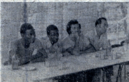
участвовали в дискуссиях,