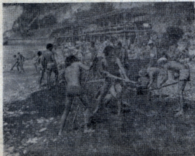
Еще мы занимались уборкой пляжа,