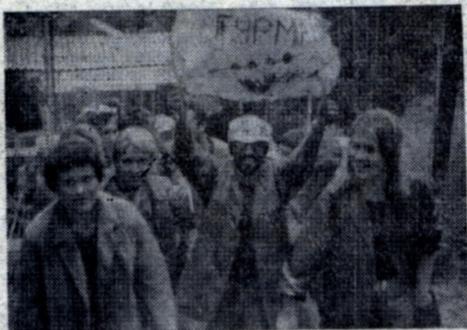
Потом мы ходили в поход, а когда вернулись, то нас встречали