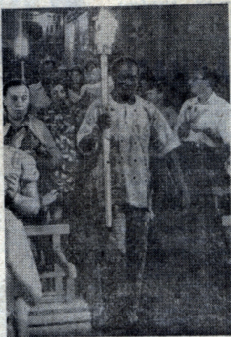
Сначала было открытие лагеря.