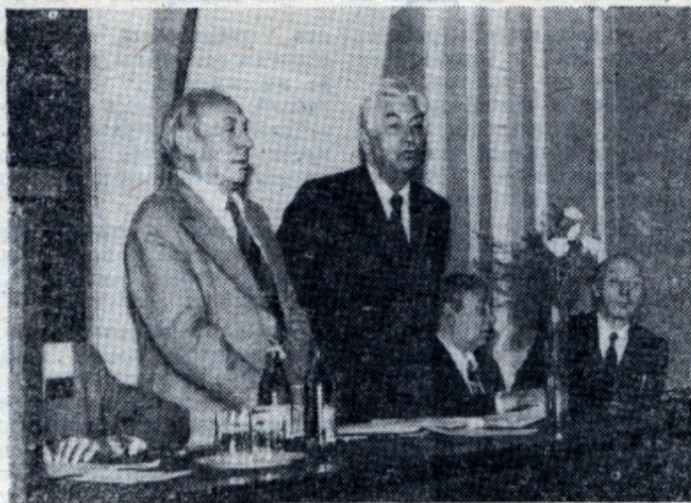
В президиуме семинара-совещания зав. кафедрами ТНВ.

В специально принятых семинаром-совещанием рекомендациях сформулирован ряд положений по улучшению работы кафедр по вопросам учебной, методической, учебно-воспитательной деятельности на современном этапе.