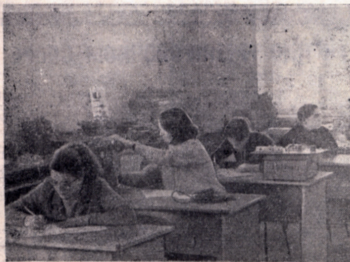
Государственный экзамен по военной подготовке. Готовятся к ответу студенты учебного взвода Т-41.