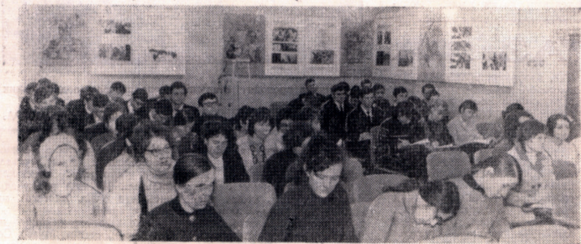
На военной кафедре: студенты 2-го курса в новом классе истории войн и военного искусства.