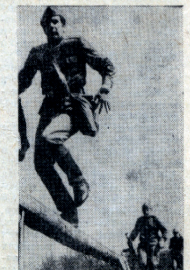
Смелые и ловкие.

Отв. за подготовку страницы С. С. АРАЛОВ.