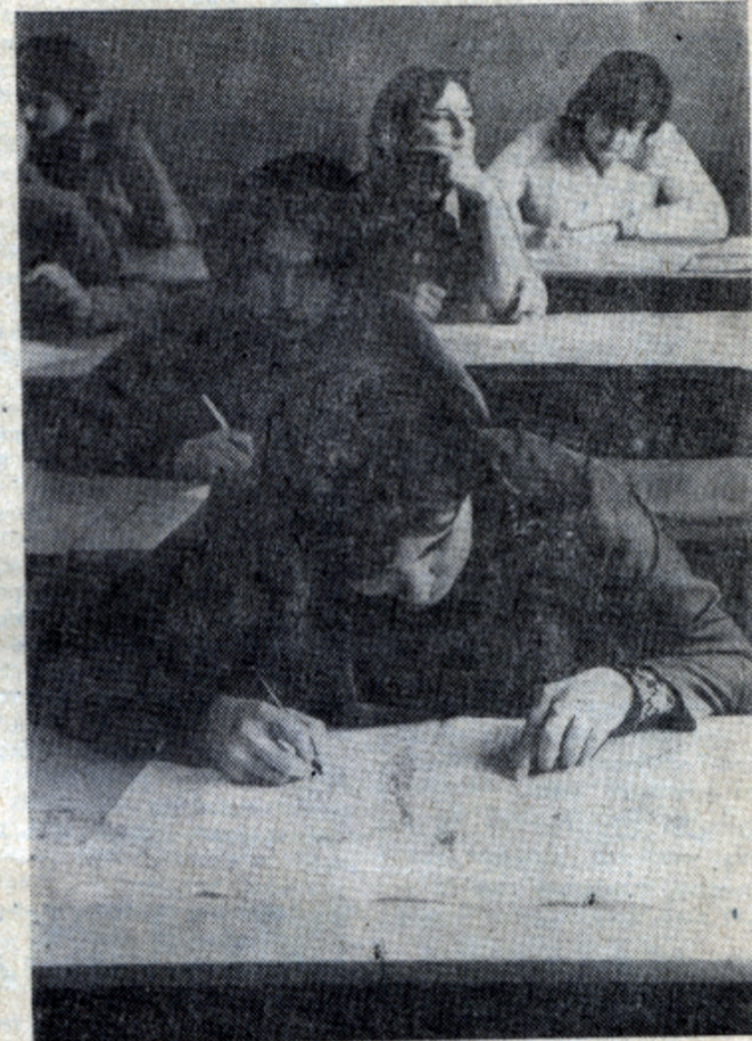
Учебный год предстоит напряженный. Серьезное отношение к занятиям с первых дней сентября — залог успешного завершения года.

Вместе с другими странами — членами Организации Варшавского договора — она осуществляет активную интернационалистическую деятельность по укреплению единства и мощи социалистического содружества, вносит большой вклад в развитие отношений мира, дружбы и сотрудничества между народами.