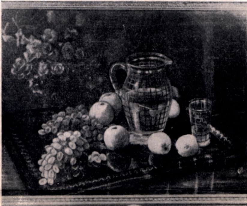
Натюрморт. Репродукция с картины старосты изокружка А. Афанасьева.

Сегодня наши молодые поэты и прозаики держат перед читателем серьезный экзамен. Трудно сказать, кто из них со временем станет маститым. Известно только, что многие маститые начинали свой путь в большую литературу с многотиражной газеты, и этот путь никому не заказан. Хочется от души пожелать нашим молодым поэтам и прозаикам доброго пути и новых творческих успехов.