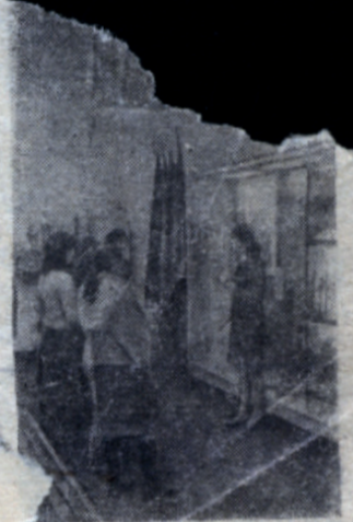
Студенты группы И-33 в залах музея.

Прошедший 1971 год — первый год девятой пятилетки. Для трудящихся Свердловского района, как и для всего советского народа, каждый его день был наполнен самоотверженной борьбой за претворение в жизнь величественной