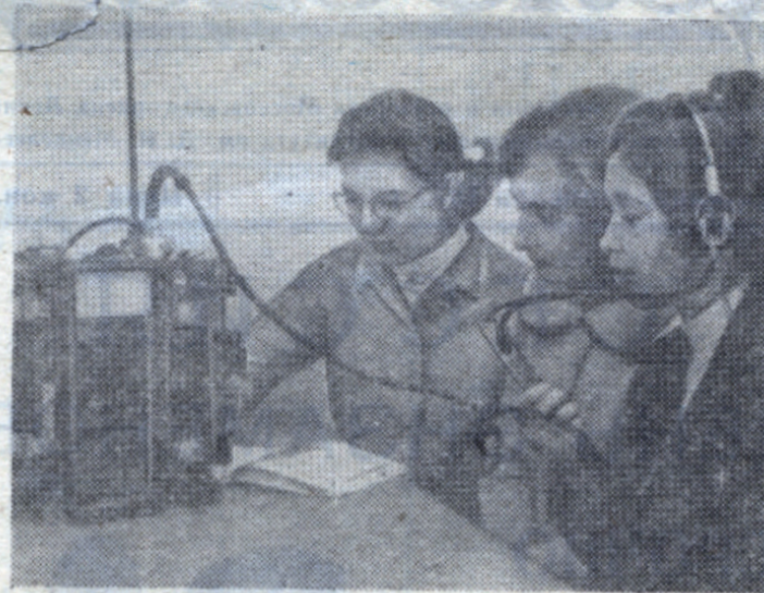
Студентки второго курса на практическом занятии по изучению радиосвязи.

...что они... ...дежат гени- ...композитору ...евичу Скря- ...ия рожде- ...б явива- ...ество. ...ого ...ого ...и насы- ...ениями исто- ...революцион- ...1905 года, в по- ...иженной реакции и ...рождения умов" в связи с по- ...давлением революционного дви- ...жения в период 1907—1912 го- ...дов, в первую мировую войну. ...Скрябин гениальным чутьем ...художника уловил напряжен- ...ное биение пульса времени, ...заряженность мира огромной