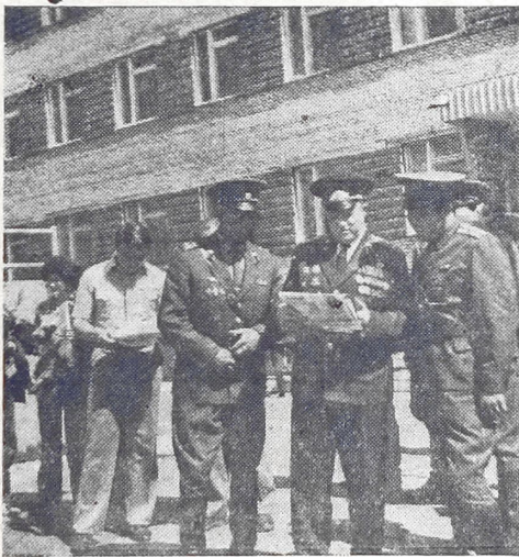
Наши судьбы похожи: Журналист — как в бою! «Менделеевец» тоже В курсантском строю.