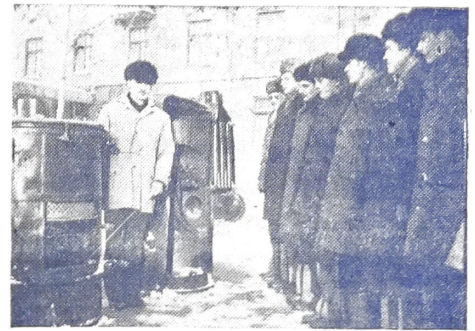
Занимались исправно: То в строю, то в кино,— Это было недавно, Это было давно.