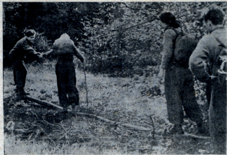
Студенты-менделеевцы в походе по Подмосквью. Переход через топкое место.

В эту ночь был установлен новый «ветуристский рекорд» вместимости