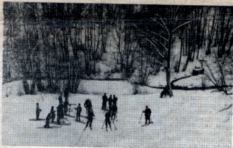
На лыжной вылазке.

И вот полсотни измотанных экзаменационной горячкой, бледных юношей и девушек с надеждой на хороший отдых и с веселым настроением выехали 25 января с Белорусского вокзала.