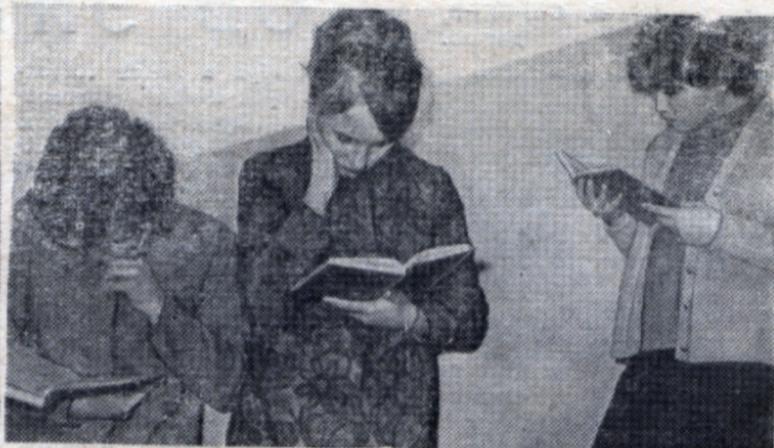
Пора коллоквиумов, зачетов и экзаменов. Вот когда действительно каждая минута — на вес золота!