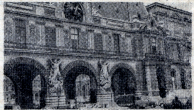
Всемирно известный Лувр.

Наряду с этим — нелепые одежды молодежи, главным образом, приезжей (американцы, англичане), рваные, специально заплатанные брюки,