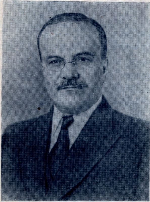
Вячеслав Михайлович МОЛОТОВ, Зам. Председателя Совета Министров СССР — кандидат в депутаты Московского областного Совета и Московского городского Совета депутатов трудящихся