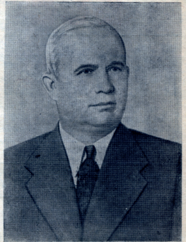
Никита Сергеевич ХРУЩЕВ, секретарь ЦК и МК ВКП(б) — кандидат в депутаты Московского областного Совета и Московского городского Совета депутатов трудящихся.