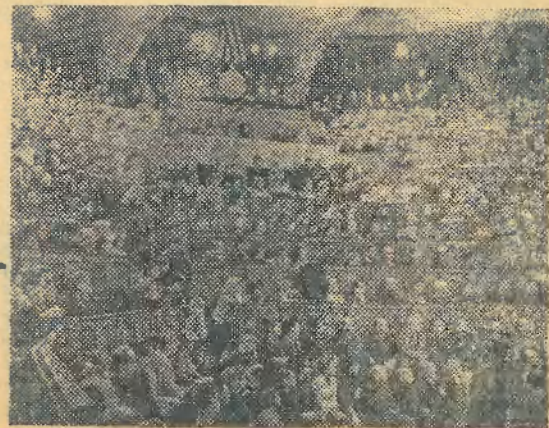
БАЗ переполнен. Чтоб он был всегда таким, нужны энтузиазм и желание работать.