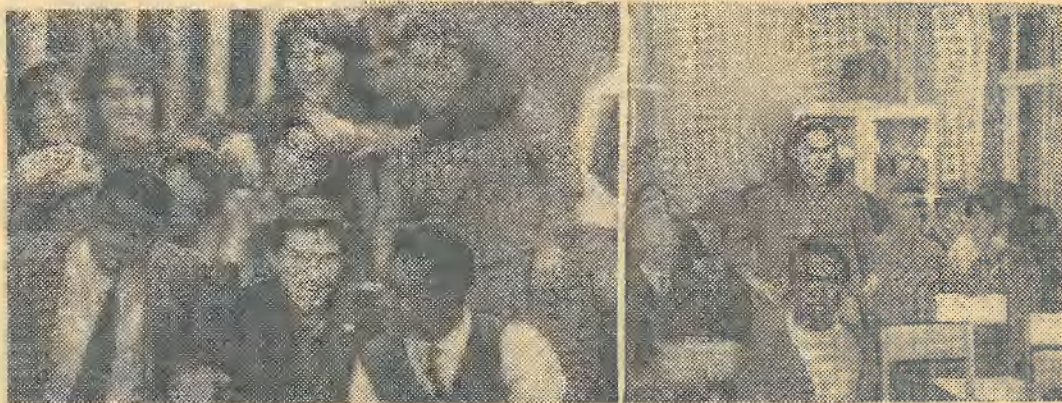
В пятом корпусе недавно создан Клуб интернациональной дружбы. На снимке: иностранные студенты МХТИ отмечают это событие.