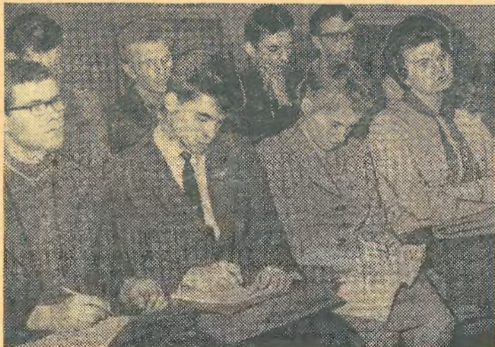
Первое занятие слушателей «Школы молодого лектора».