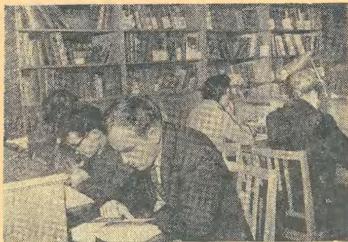
В нашей библиотеке. Читальный зал для преподавателей.

В лекционной работе активное участие примут ученые и преподаватели нашего института. На предприятиях нашего Тимирязевского района они прочтут лекции и доклады о Великой Октябрьской социалистической революции, расскажут о достижениях советской химии.