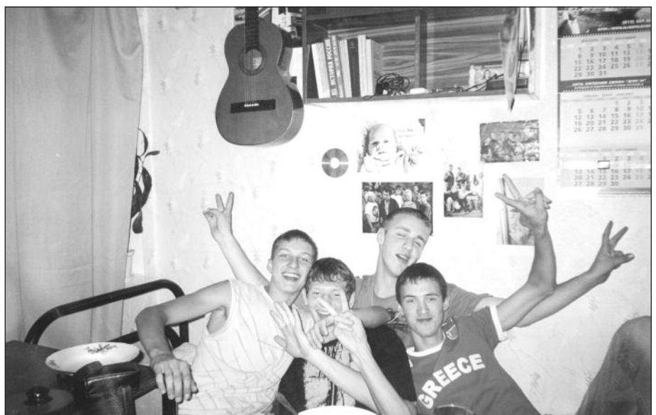
Новоселье... Виват, общежитие! Фото с выставки "В объективе - Менделеевка", Добровольская А., С-27