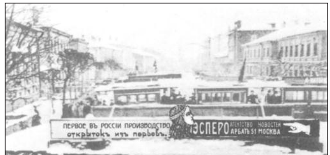
Москва в баррикадах и развалинах. Долгоруковская. Заграждение из вагонов конки.