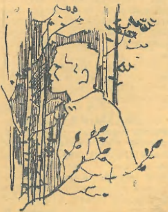
Слова и музыка А. ГОРОДНИЦКОГО.

Их свет дневной не радует, Им ночью не до сна, Их красоту снарядами Уродует война. Стоят они навеки, Уперши лбы в беду, Не боги — человеки, Привычные к труду. И жить еще надежде До той поры, пока Атланты небо держат На каменных руках.