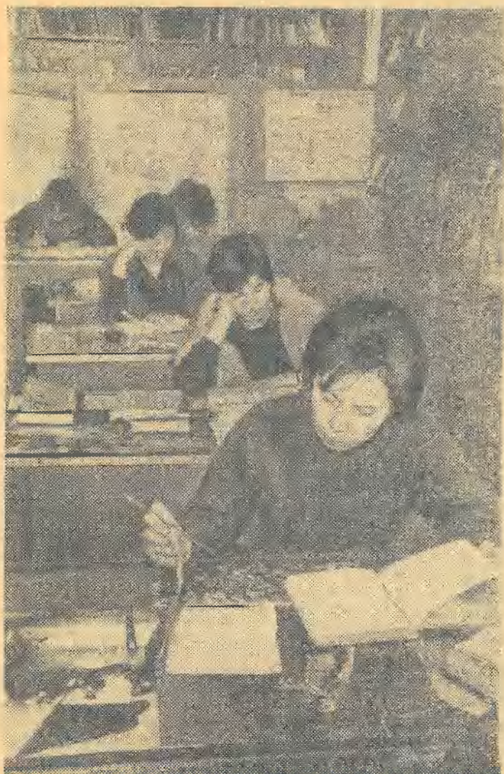
В эти дни многолюдно в кабинете марксизма-ленинизма. Сочинения Ленина, Маркса, Энгельса, материалы современной общественной и политической жизни — вот что волнует студентов.