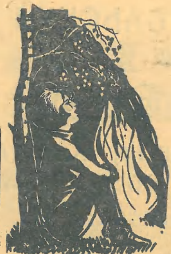
У КОСТРА Рисунок О. МАКАРОВА.

Понимаешь, это странно, очень странно, Но такой уж я законченный чужак: Я гоняюсь за туманом, за туманом, И с собою мне не справиться никак. Люди посланы делами, Люди едут за деньгами, Убегают от обиды, от тоски. А я еду, а я еду за мечтами, За туманом и за запахом тайги. Пошмаешь, это просто, очень просто Для того, кто хоть однажды ухаживал. Ты представь, что это остро, очень остро: Горы, солнце, пихты, песни и дожди. Пусть полным-полно набиты Мне в дорогу чемоданы — Память, грусть, невозвращенные долги, А я еду, а я еду за туманом, За мечтами и за запахом тайги.