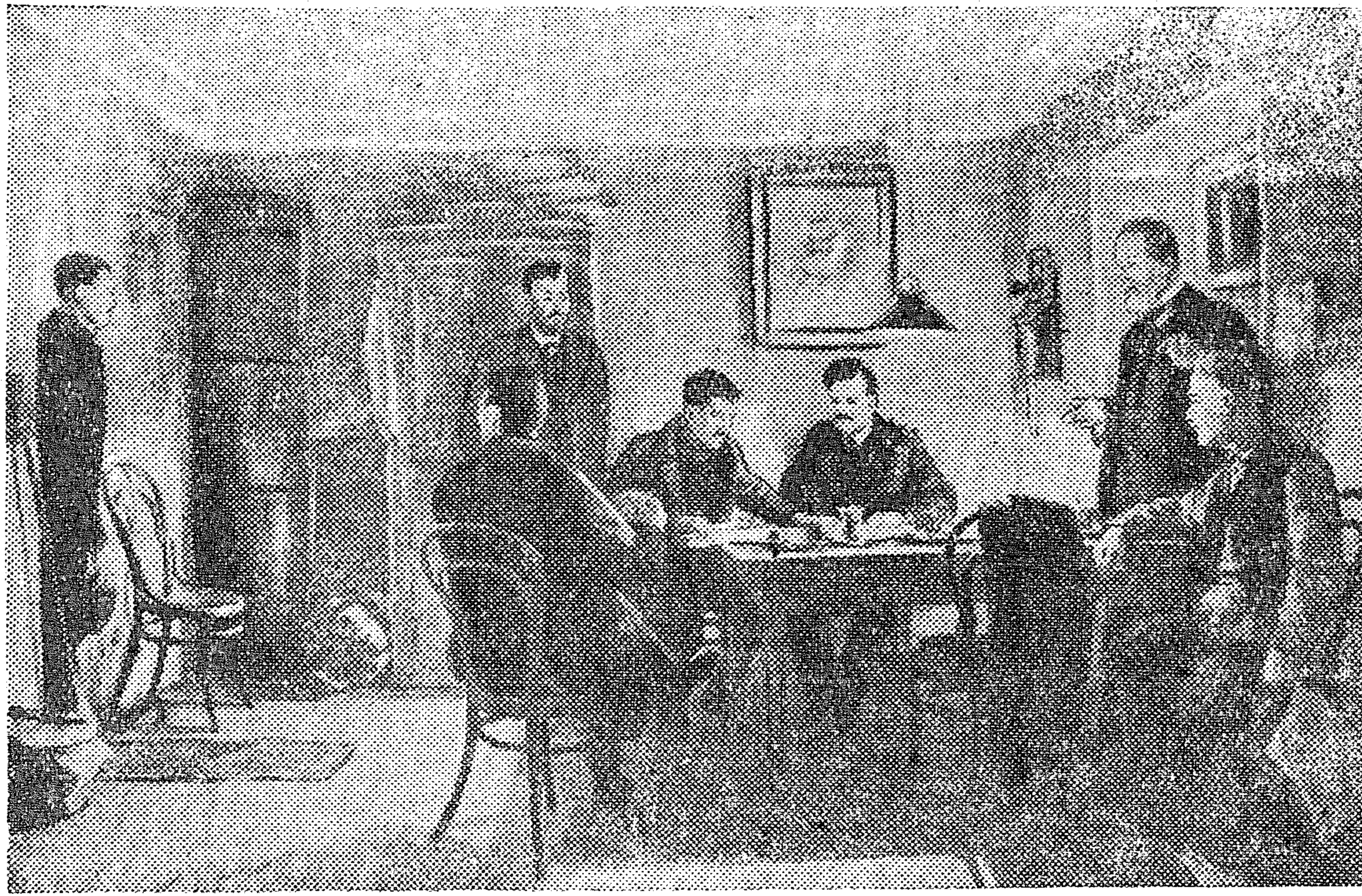
В редакции газеты «Правда» (1912 г.) товарищи Молотов, Ольминский и Полежаев беседуют с рабочими корреспондентами. С картины художника Н. ДЕНИСОВСКОГО.