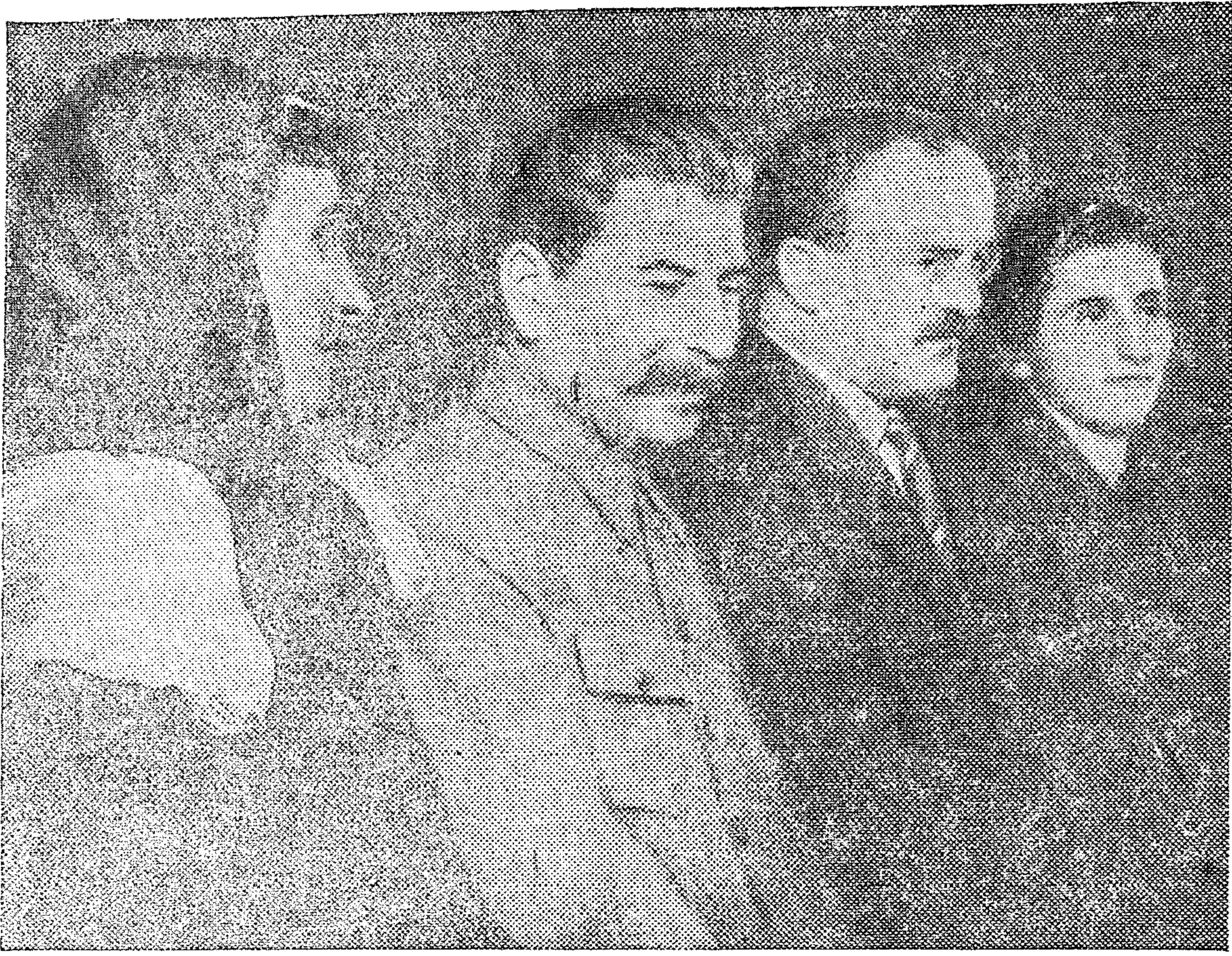
Товарищи И. В. Сталин и В. М. Молотов среди колхозников Грузинской ССР. (1935 г.).