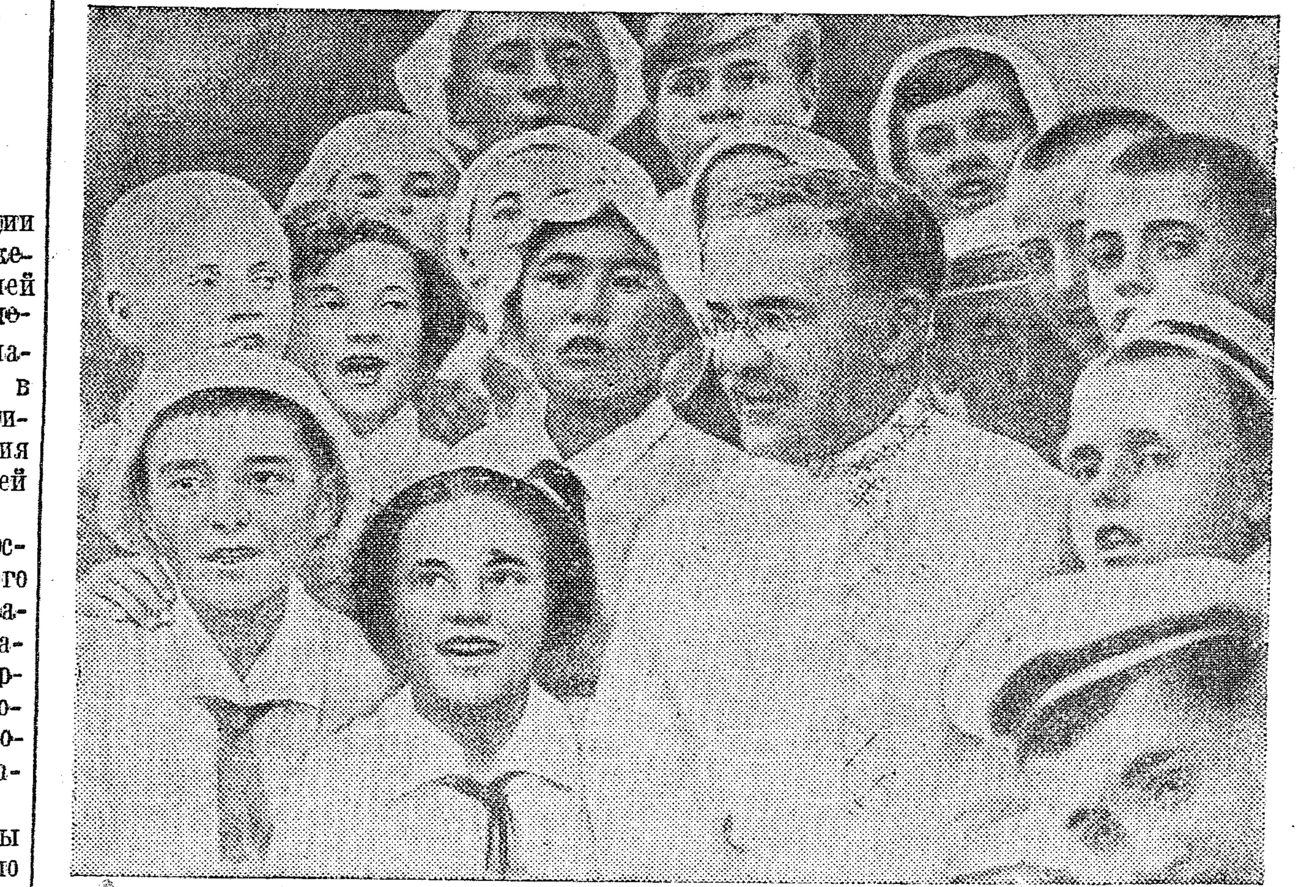
В. М. Молотов среди артековцев. (1936 г.).

Вячеслав Михайлович внимательно выслушивал всех выступавших, тщательно вникал в сущность дела. В решении всех вопросов чувствовалась твердость, огромный государственный опыт, блестящее знание народного хозяйства. Я заметил, с каким глубоким уважением относились все члены Совета к суждениям товарища Молотова.