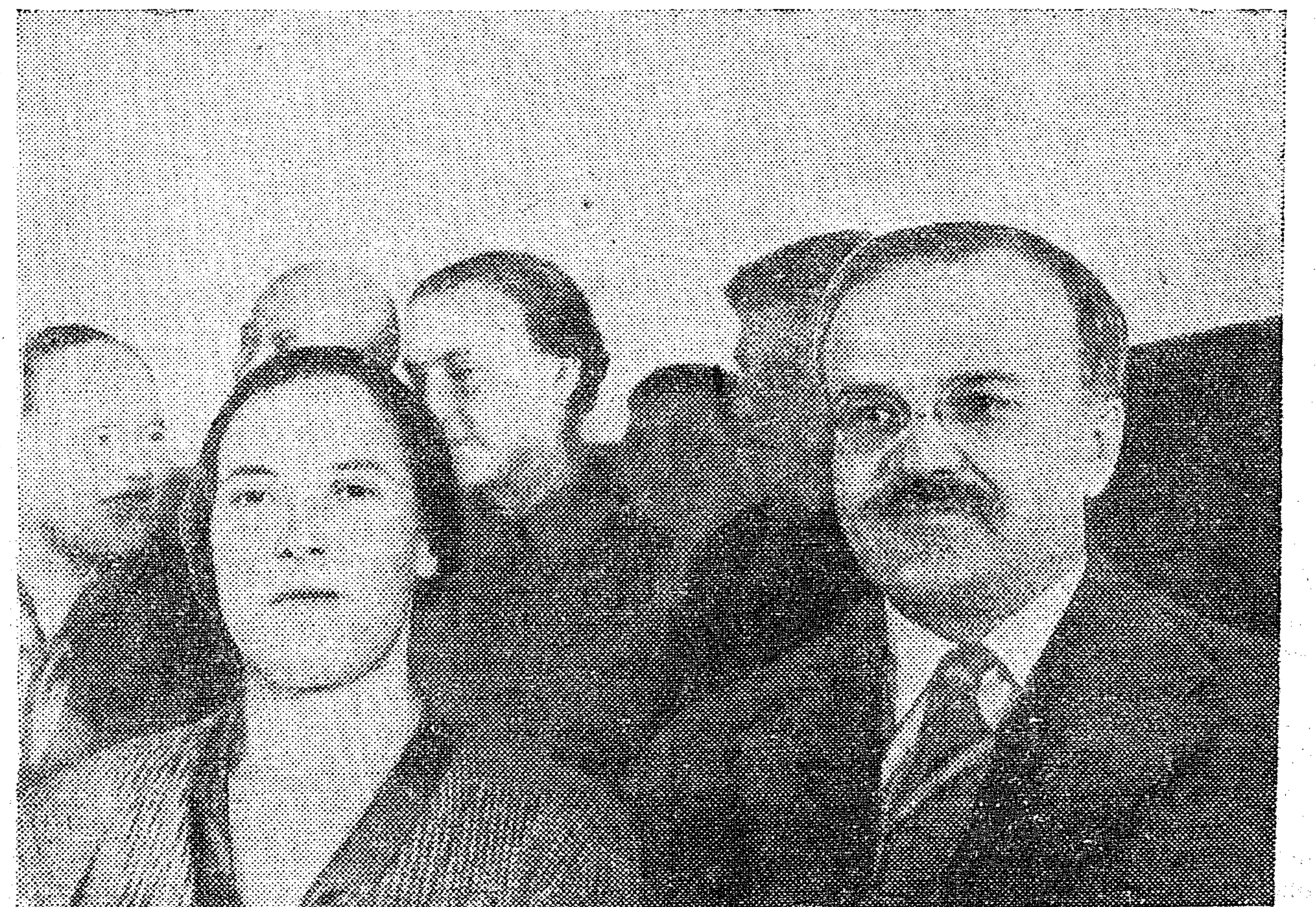
В. М. Молотов среди делегатов-колхозников Воронежской области на 2-м Всесоюзном съезде колхозников-ударников.

Тов. Молотов — депутат Верховного Совета СССР и депутат Верховных Советов союзных и автономных советских социалистических республик.